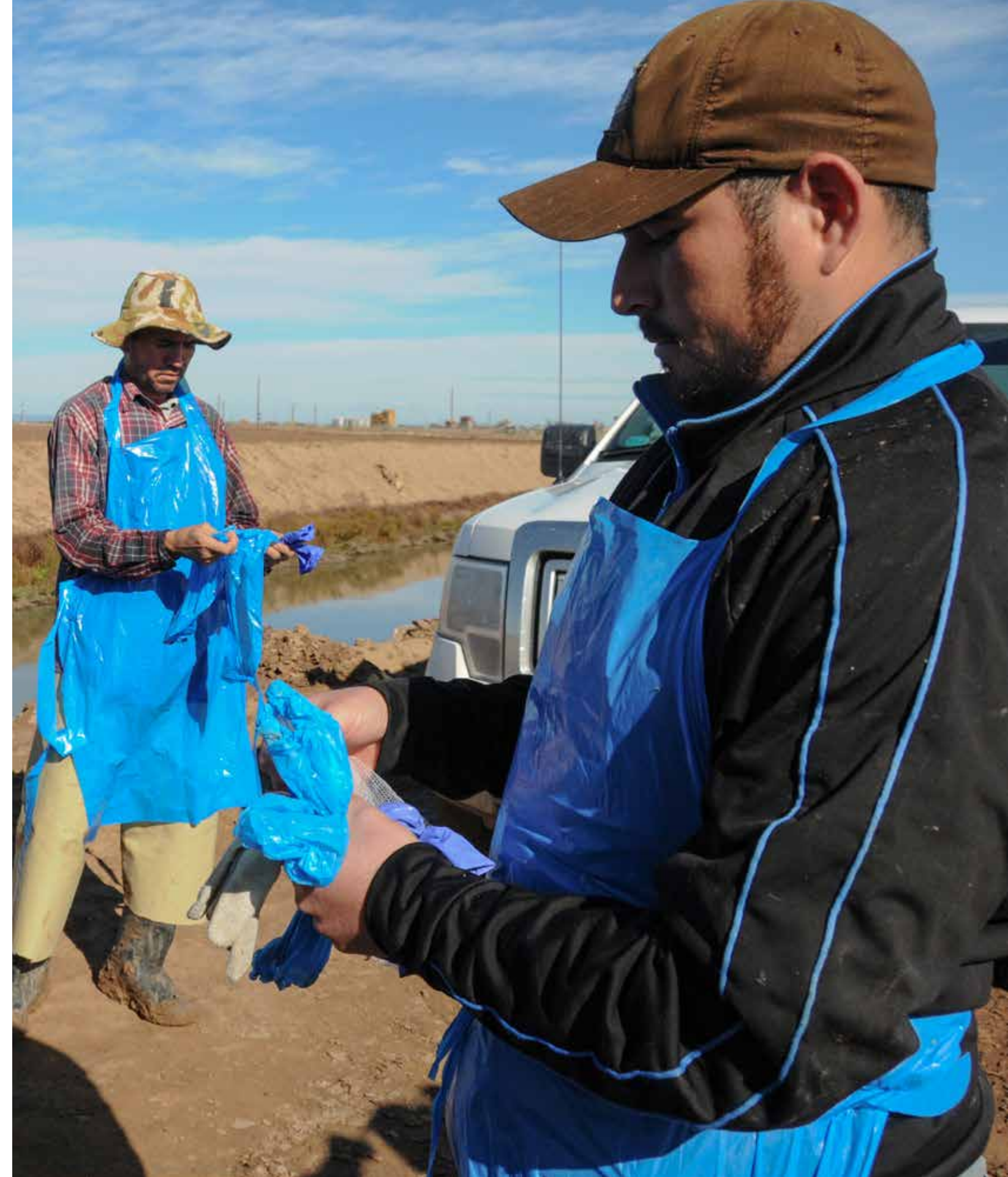
Lavado de manos y uso de guantes