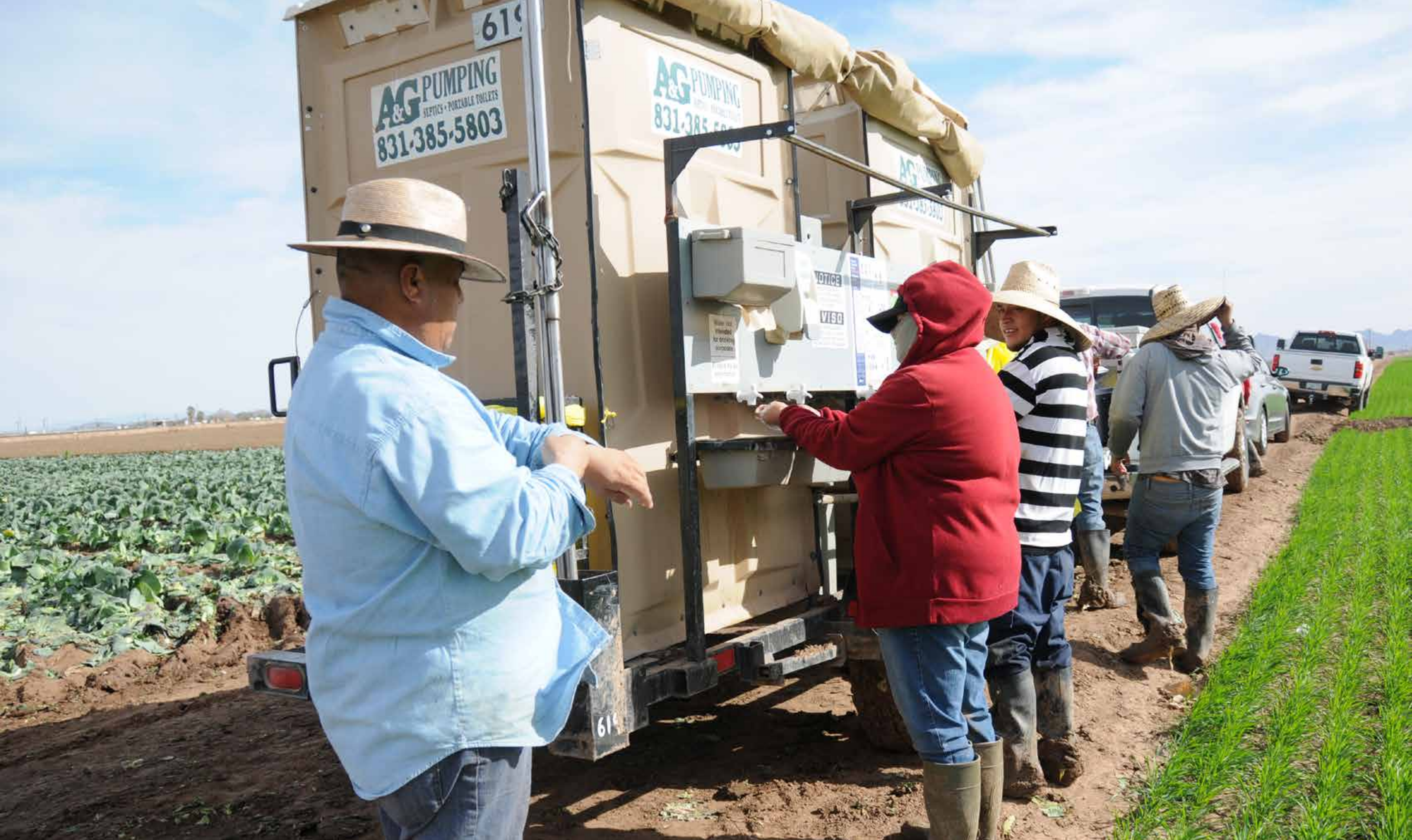
Activity 1-Practicing Handwashing