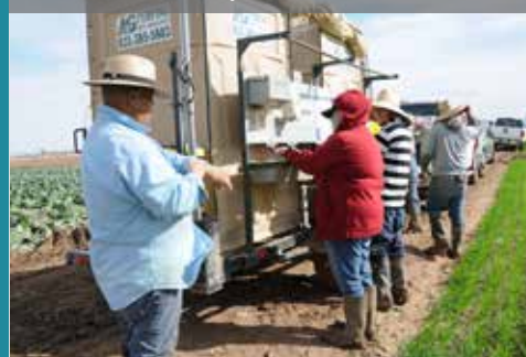
Alternate Version of Activity 1 / Versión alternativa de la actividad 1

Instructor's Notes / Notas del Instructor: