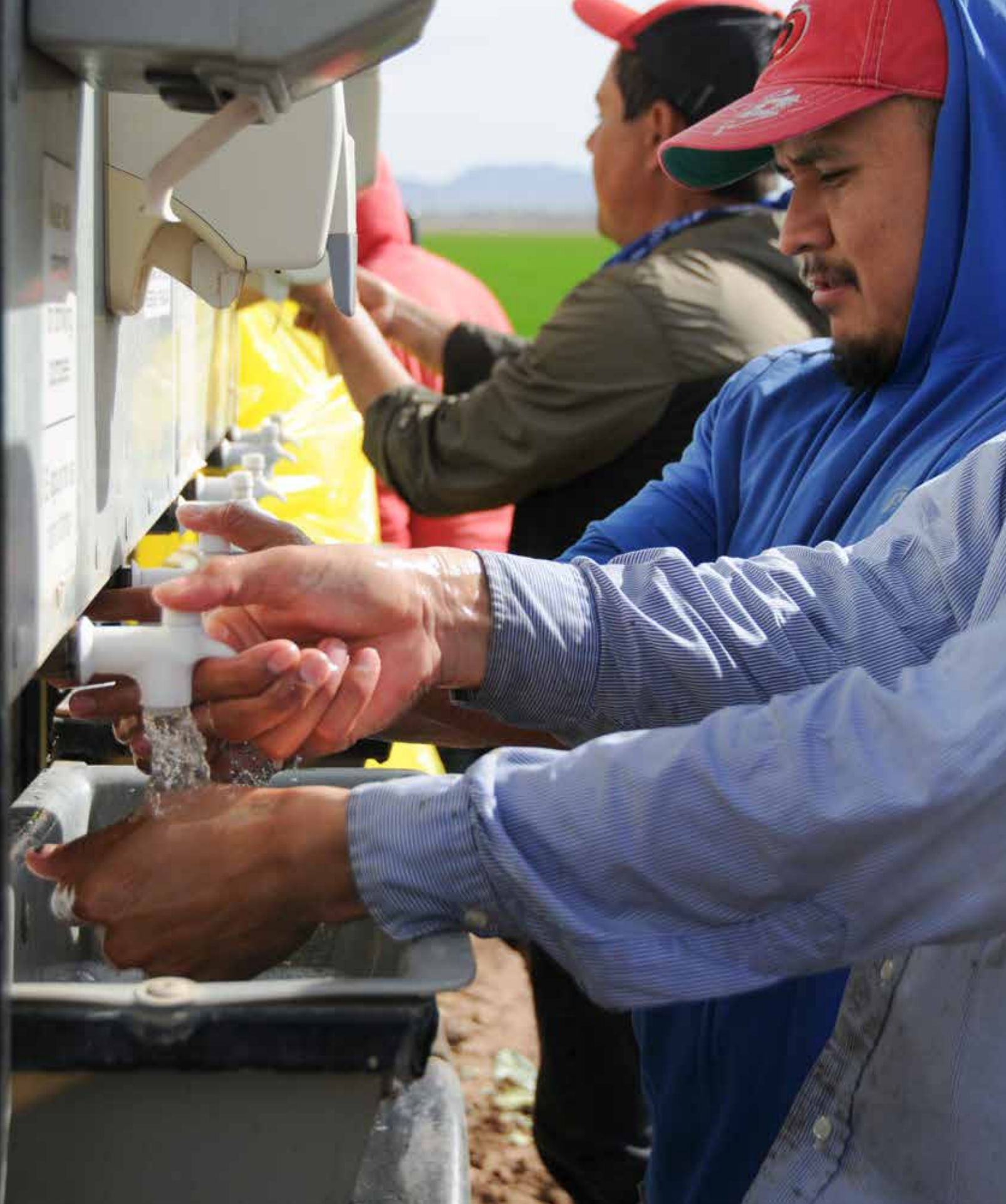
Handwashing and Glove Usage