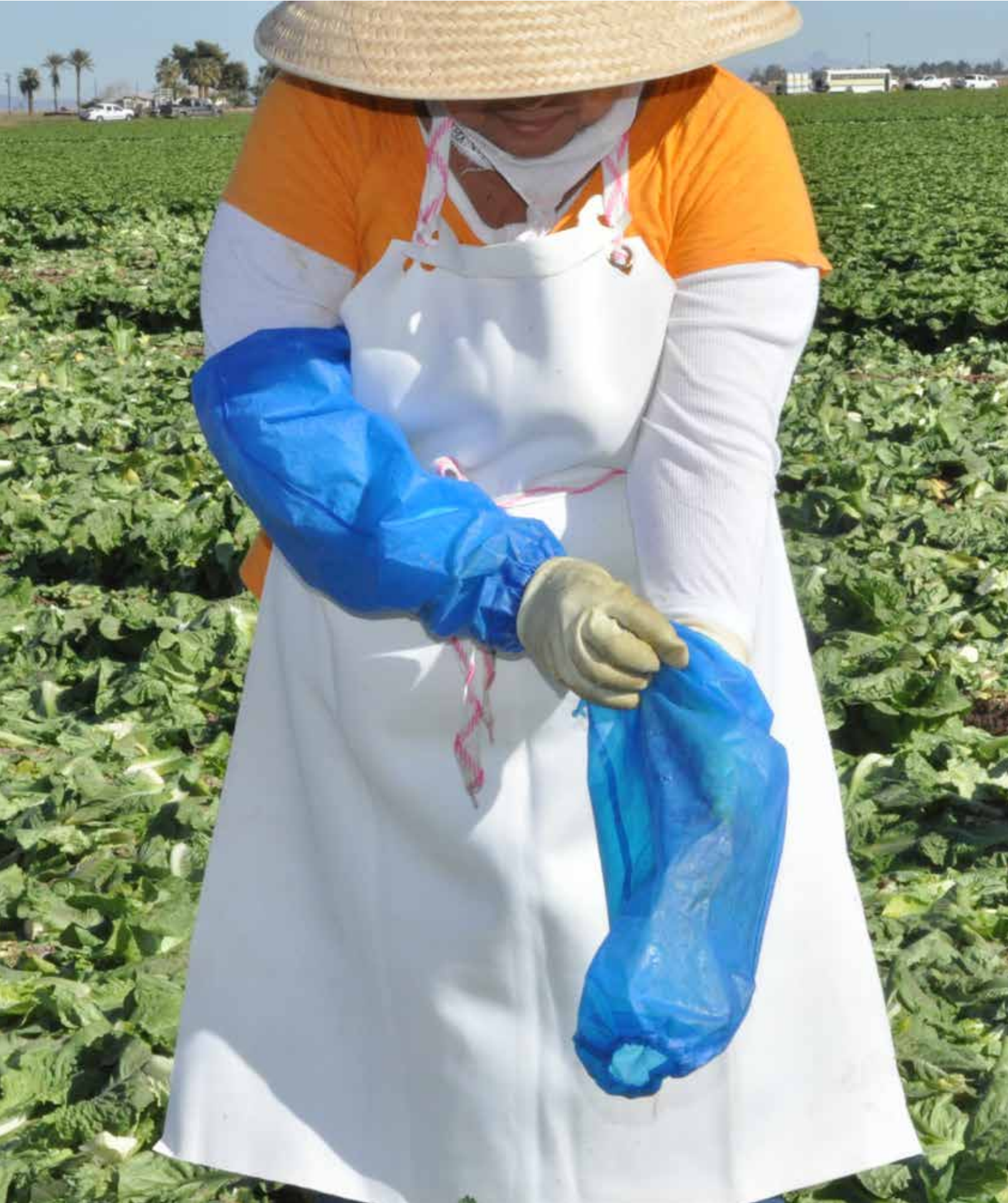
When is Handwashing Needed?