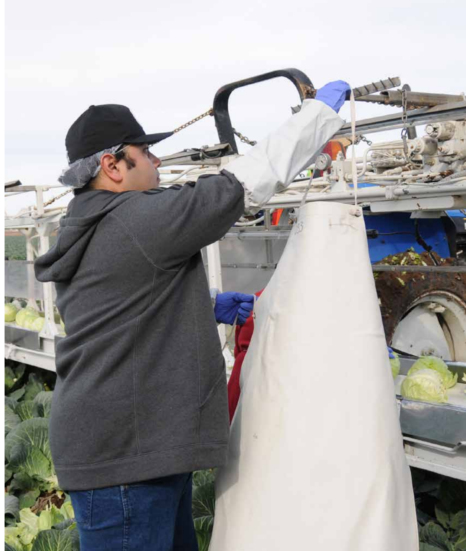
¡Un grave error!