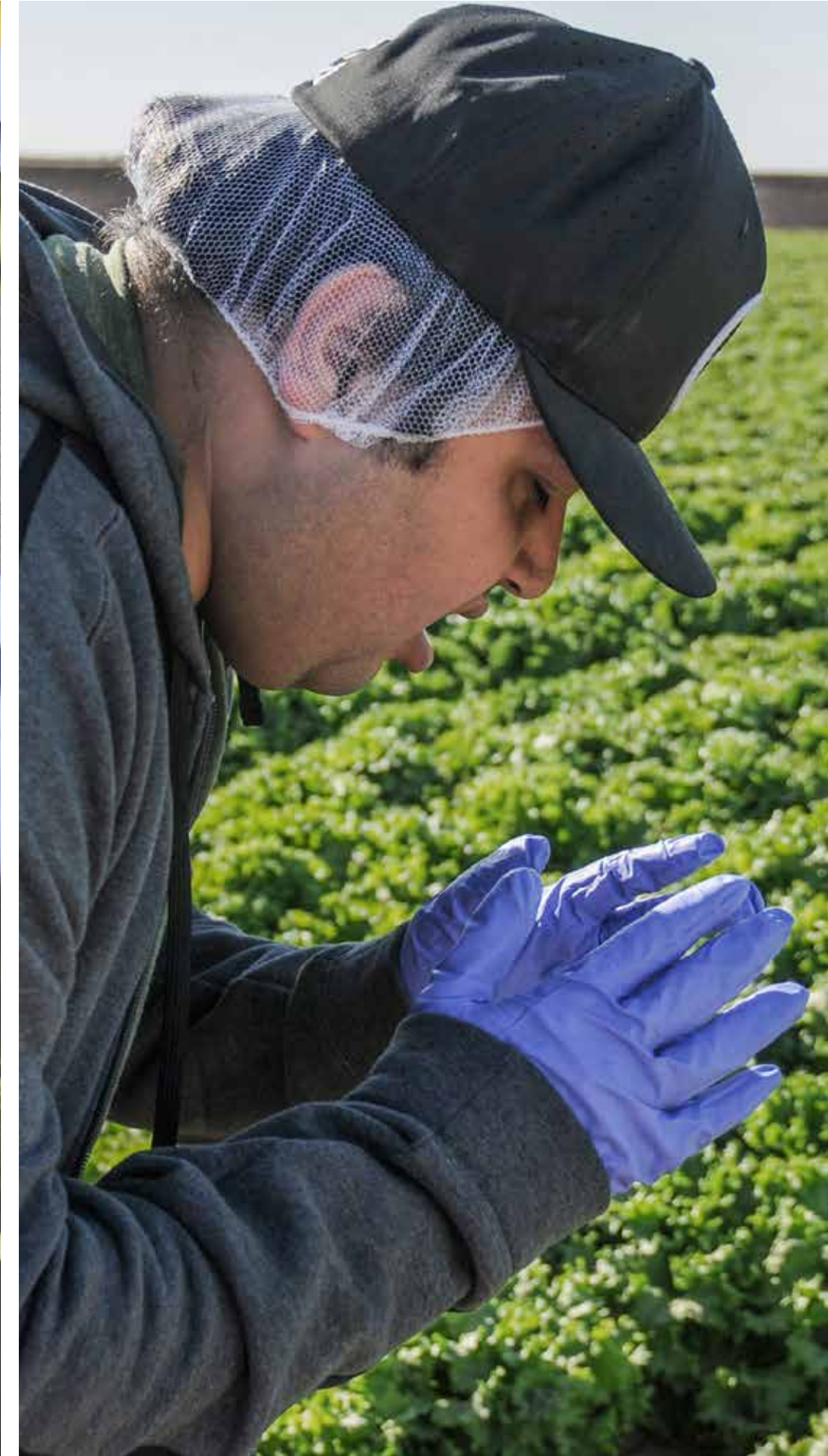
Uso de los guantes